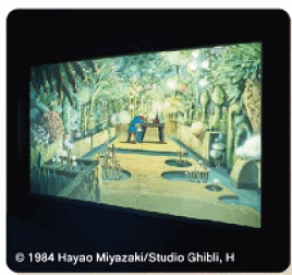
© 1984 Hayao Miyazaki/Studio Ghibli, H