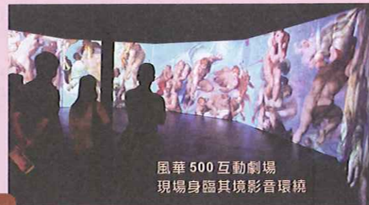
風華 500 互動劇場 現場身臨其境影音環境

漢字，就像水裡悠游的魚兒一樣，是有生命的。 且看！腳下有新鮮文字魚在游動著，伸手一揮，甲骨文字竟變成楷書文字魚。試試您的手氣，看看會變化出甚麼文字^_^